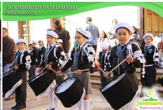
ESTUDIANTES DE PREESCOLAR Y PRIMARIA PARTICIPANDO DURANTE EL PROGRAMA CÍVICO.

24 DE FEBRERO 2017, DÍA DE LA BANDERA JERÉCUARO, GTO.