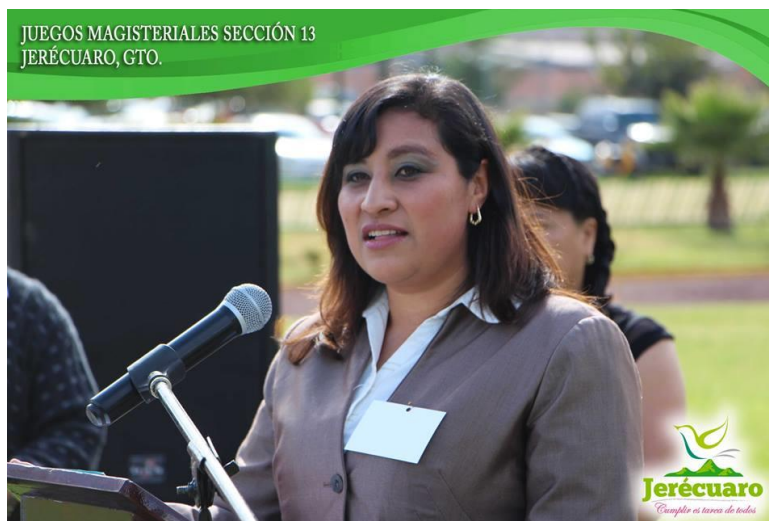
LAS "JORNADAS ARTÍSTICAS, DEPORTIVAS Y CULTURALES", UN FORO PARA ESTRECHAR LA COMUNICACIÓN ENTRE EL MAGISTERIO Y LA AUTORIDAD MUNICIPAL DE ESTA REGIÓN SINDICAL.