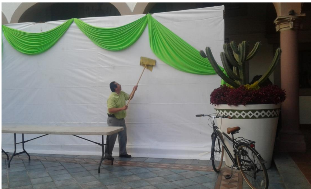
LIMPIEZA DE MAMPARA HABILITADA CON EL APOYO DE PERSONAL DEL ÁREA DE EDUCACIÓN.