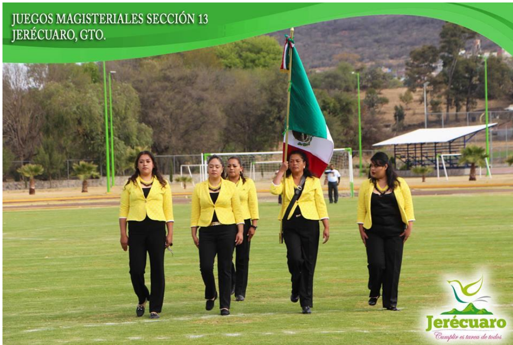
PROFESORAS DEL MUNICIPIO DE CORONEO INTEGRANTES DE LA ESCOLTA.