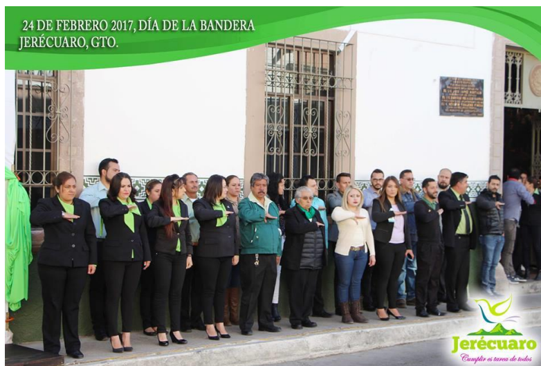
PERSONAL DE LA ADMINISTRACIÓN MUNICIPAL ASISTENTE AL EVENTO.