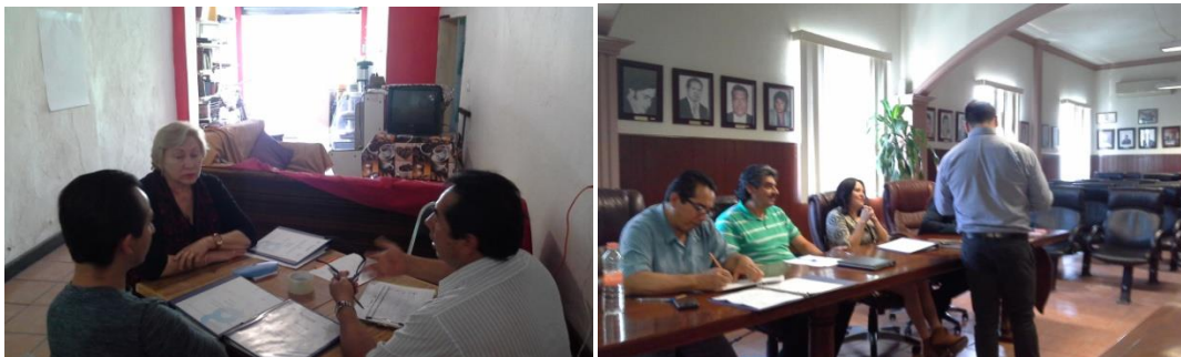
EL DIÁLOGO Y LA PARTICIPACIÓN INDIVIDUAL Y GRUPAL FUERON HERRAMIENTAS FUNDAMENTALES DURANTE LA REALIZACIÓN DEL TALLER