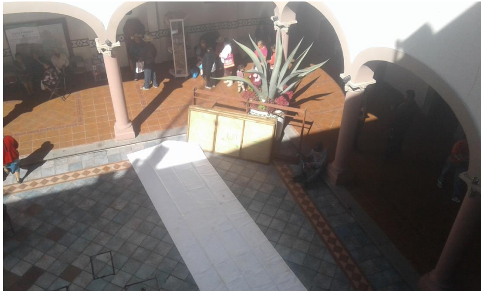
PREPARANDO LAS TARIMAS PARA DARLES EL MANTENIMIENTO QUE REQUIEREN PARA SU CONSERVACIÓN.