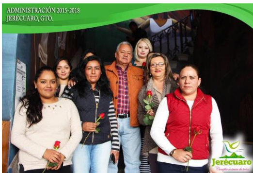
IMÁGENES DEL PERSONAL AL TÉRMINO DEL EVENTO.