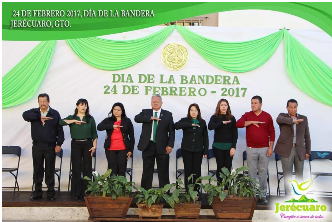
INTEGRANTES DEL H. AYUNTAMIENTO DE JERÉCUARO, DURANTE LA REALIZACIÓN DE LOS HONORES A LA BANDERA.