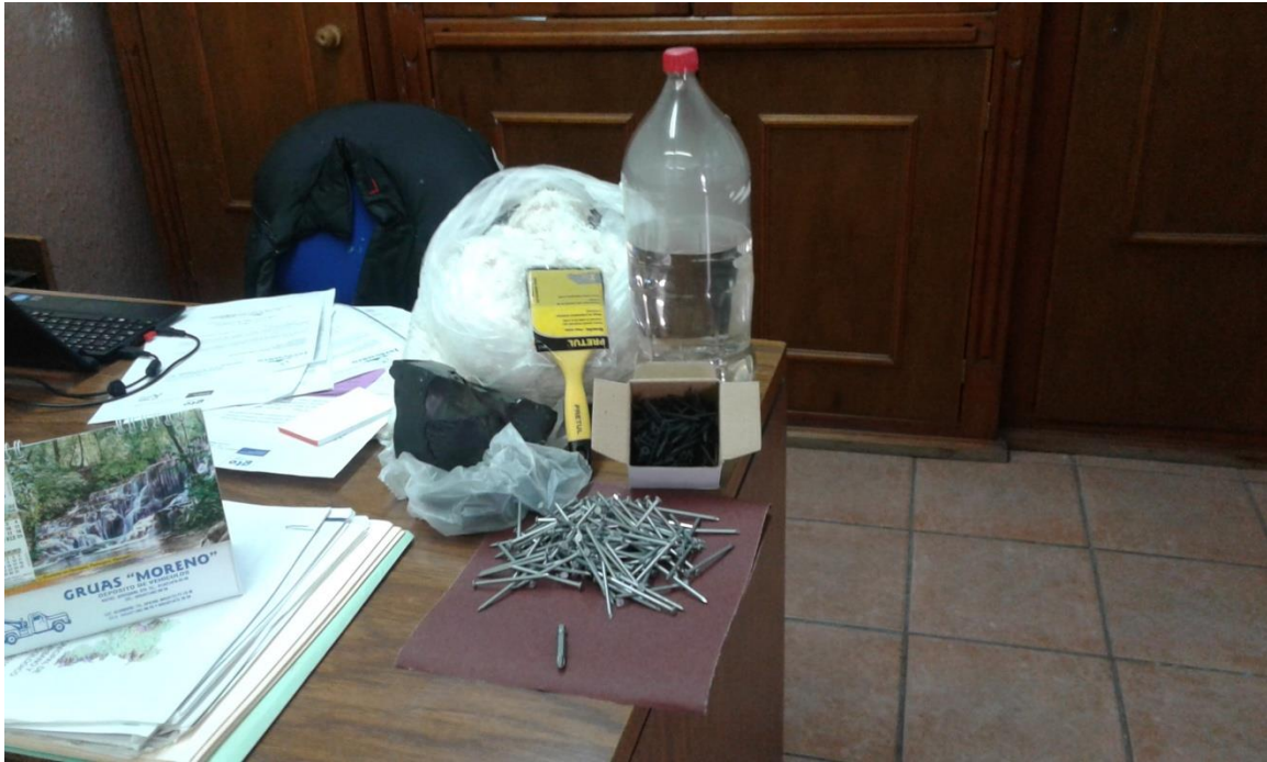
REQUISICIÓN Y ADQUISICIÓN DE LOS MATERIALES PARA DAR MANTENIMIENTO A MACETAS PARA ADORNO, TARIMAS PARA TEMPLETE Y PUERTA DE LA BIBLIOTECA MUNICIPAL.