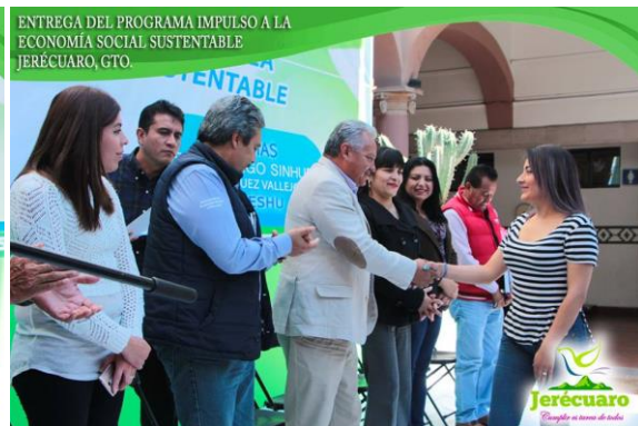
AUTORIDADES HACIENDO LA ENTREGA DE RECURSOS A LOS BENEFICIARIOS DEL PROGRAMA PIES