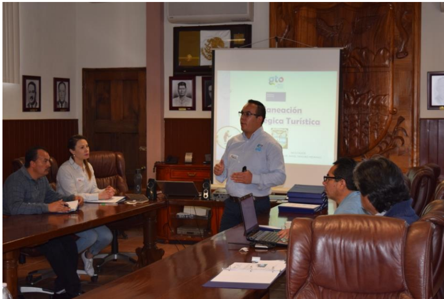
LA COORDINACIÓN DE LAS ACTIVIDADES DE APRENDIZAJE, PARTIR DE UN ENFOQUE CONSTRUCTIVISTA.