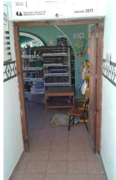
ASPECTO DE LA PUERTA DE LA BIBLIOTECA MUNICIPAL “JOSÉ AGUILAR Y MAYA” ANTES DE DARLE MANTENIMIENTO.