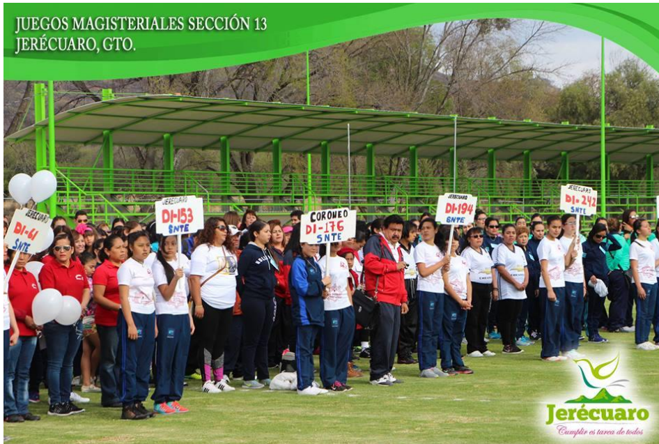
SE CONTÓ CON LA PARTICIPACIÓN DEL MAGISTERIO ORGANIZADO.