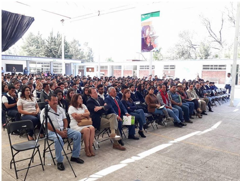
EL PRESIDENTE MUNICIPAL E INTEGRANTES DEL H. AYUNTAMIENTO, ACOMPAÑANDO AL LIC. JOSÉ LUIS ROMERO HICKS.