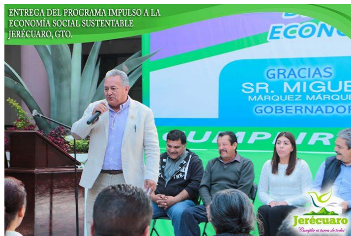
EL PRESIDENTE MUNICIPAL DE JERÉCUARO, C. JORGE VEGA CASTILLO DURANTE EL ENVÍO DEL MENSAJE INSTITUCIONAL