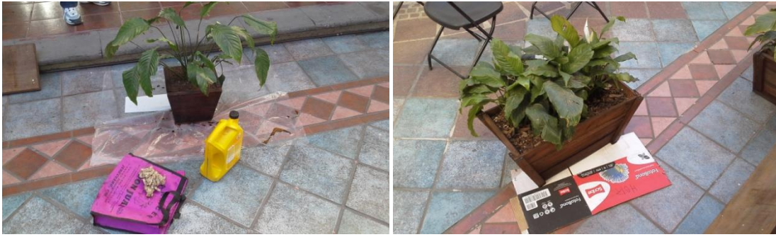
SE DIO MANTENIMIENTO A LAS MACETAS, TABLÓN Y BASES PARA ADORNAR EL ESTRADO, LOGRÁNDOSE ASÍ UN AHORRO EN COMPRA DE ARREGLO FLORAL.